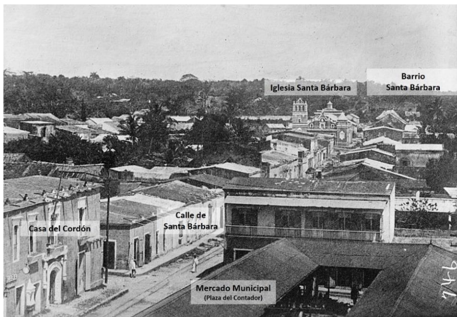
Figura 3. Vista del acceso al barrio de Santa de Bárbara.