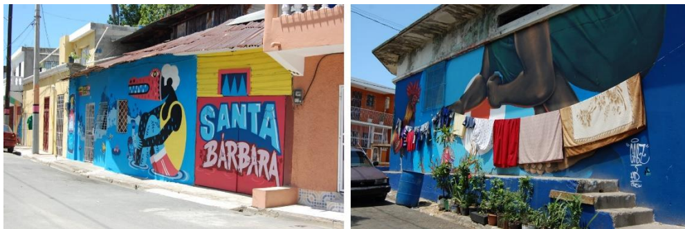
Figura 5. Arte urbano en muros de viviendas en Santa Bárbara.

En 1989 la Oficina de Patrimonio Cultural eliminó la calle frente a la iglesia, recuperando ese espacio como plaza, rehabilitando además las edificaciones frente al templo convirtiéndolas en salón parroquial, casa curial y otras dependencias religiosas. En estos momentos el barrio sigue siendo una zona marginal de la Ciudad Colonial de Santo Domingo. Las calles y callejones están en mal estado, en ocasiones sin pavimento, no hay alcantarillado, ni aceras y en algunos lugares no hay servicio de agua potable. Actualmente viven trabajadores, la mayoría de bajo recursos económicos (Fig. 5 y 6).