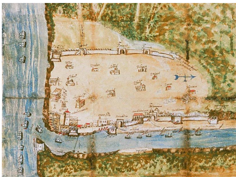
Figura 1. Plano de las defensas de la ciudad de Santo Domingo de 1619, con el lado norte sin terminar.

En la ciudad de Santo Domingo la construcción de las murallas inició a mediados del siglo XVI y en 1681 todavía estaba abierta la banda del norte de las murallas (Fig.1), comenzándose a cerrar en ese año con la construcción del fuerte de Santa Bárbara. Así lo confirmó un documento de don Juan F. Montemayor Córdoba y Cuenca donde alabó a don Gutierre de Meneses, hijo del Conde de Peñalva «por el trabajo y asistencia continua que hasta entonces tubo en una fortificación que fomentó se hiciese en lo alto de Santa Bárbara» 24 .